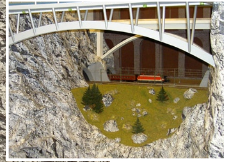
Anwendungsbeispiel Anlagenfoto: Lintner