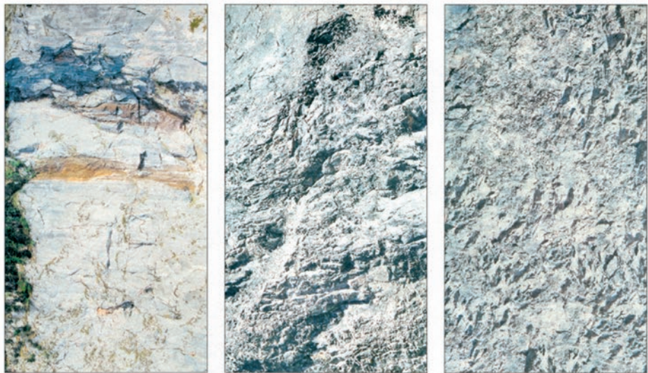
▲ ▶ Drei unterschiedliche Dietrich-Felsdrucke im Vergleich: Variante 4 „Steilwand mit Wasser“ (links) sowie die Kalkstein-Varianten 2 und 1

Wichtig ist allerdings, die durch das Zerknittern neu entstandenen Grate abschließend durch ein Setzen von so genannten Lichtern optisch hervorzuheben. Man bewirkt dies mittels Graniertechnik: Dabei nimmt man von einer Palette oder einem flachen Brettchen mit einem Flachpinsel minimale Mengen weißer Farbe auf und bestreicht damit alle hervorstehenden Grate und Kanten. Natürlich