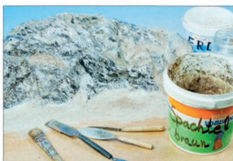
▲ Mit Sandspachtel werden die Ränder des Felsgebildes sowie Mulden, Scharten und kleine Unebenheiten ausgeglichen bzw. modelliert; Steine und Schotter sorgen für Felsbrocken- und Geröllnachbildungen am Fuße des Felsens.