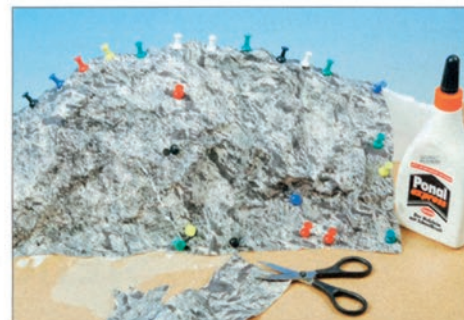
▲ Nach dem Weißleimauftrag auf die Spanten wird das zerknüllte Felsvlies aufgeklebt. Mit der Schere werden Überlappungen ausgeschnitten.