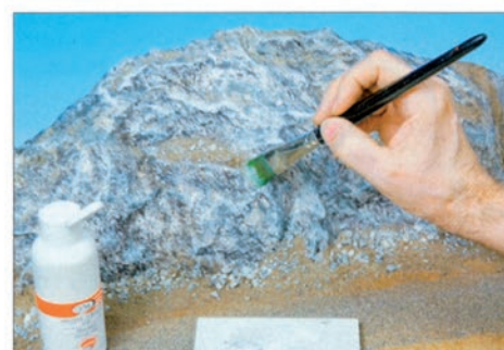
▲ Nach der Farbbehandlung mit unterschiedlichen Farbpulvern erhalten die Knitterkanten und Grate helle Hervorhebungen.

werden dadurch die durchs Zerknüllen der bedruckten Folie entstandenen Strukturen optisch etwas zu deutlich betont und harmonisieren nicht immer mit dem aufgedruckten Relief – allerdings fällt dieser Effekt nur bei sehr genauer Nahbeachtung auf.