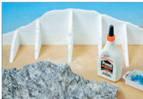
▲ Auf einer festen Kartonunterlage werden Rückwand und Spanten aufgeklebt. Das Felsmassiv aus Papier im Vordergrund liegt schon bereit.