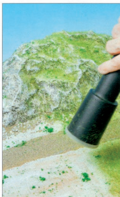
▲ Die Flora besorgt das elektrostatische Begrasungsgerät aus Fasern und Flocken, die auf Noch-Graskleber aufgebracht werden. Abschließend werden Weg und Weideumzäunung angelegt und die Flächen mit Kühen und Fahrzeugen belebt.

Die bereits angesprochene Korrosion sorgt auch für herabgefallene Gesteinsbrocken, die sich am Fuß der Felsen sammeln. Auch diese sollte man im Bodenbereich der kleinen Felserhöhung nachbilden. Splitt, Schotter und kleine Steinchen in möglichst gleicher Gesteinsart liefern für diese Gestaltungsaufgabe das ideale Material. Abschließend geht es nur noch darum, das Umfeld